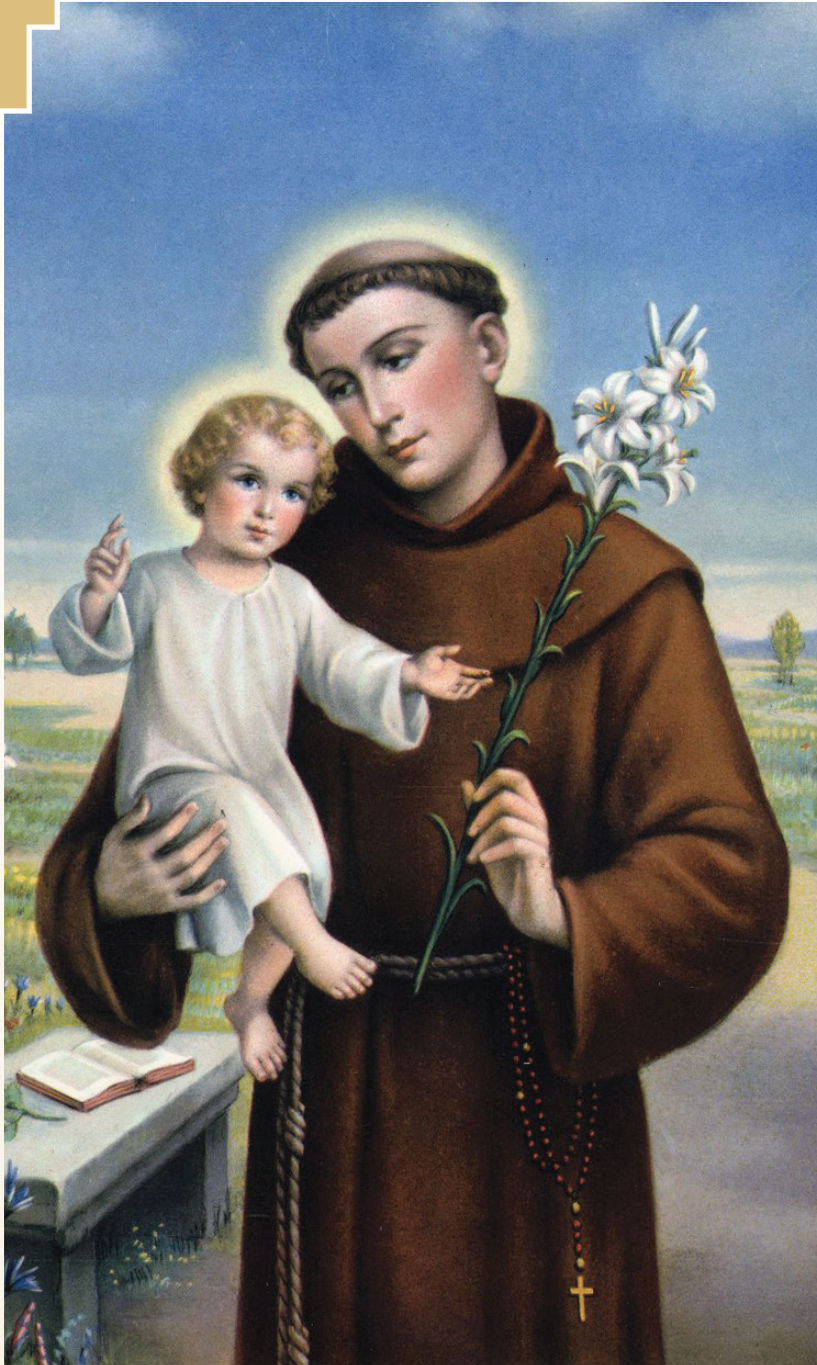
Shën Ndou i Padovës