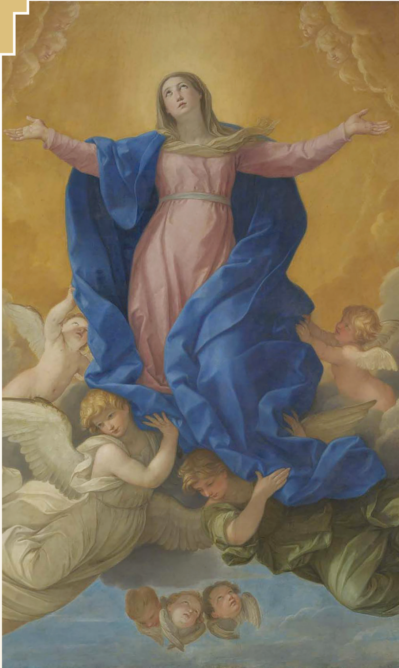
Të ngriturit e Marisë Virgjër në Qjell