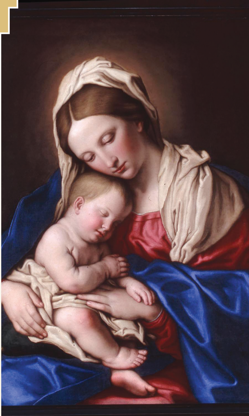
Virgjëra Mari Hyjlindëse