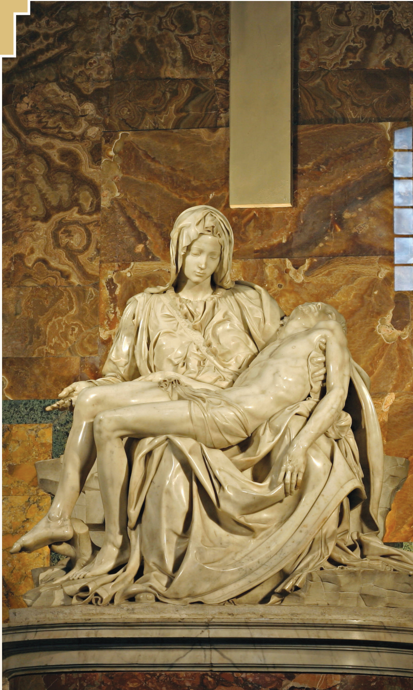
Virgjëra Mari e Dhimbshme