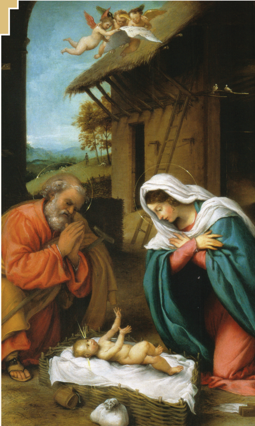
Lindja e Jezusit në Betlehem