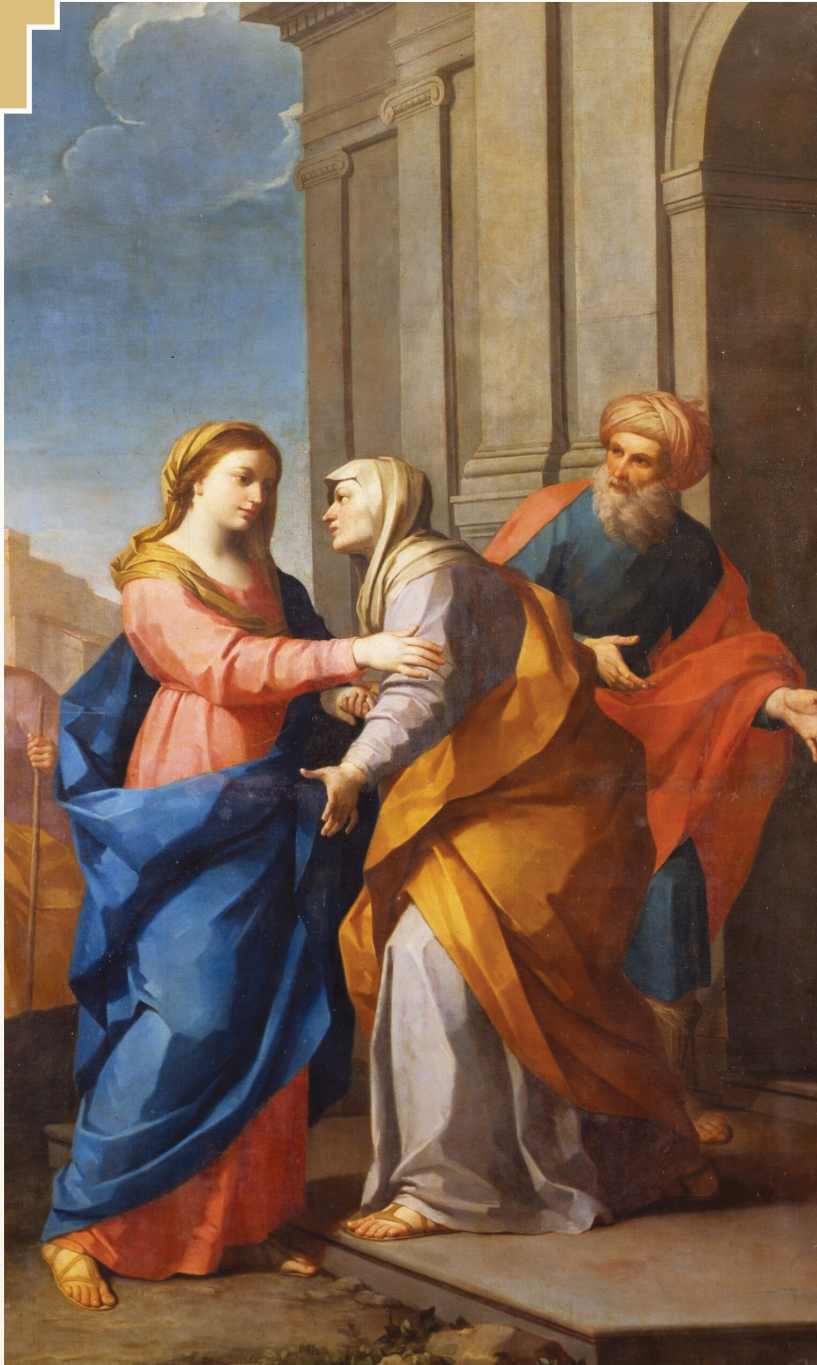
Vizita e Virgjërës Mari te kushërira e saj Elizabeta