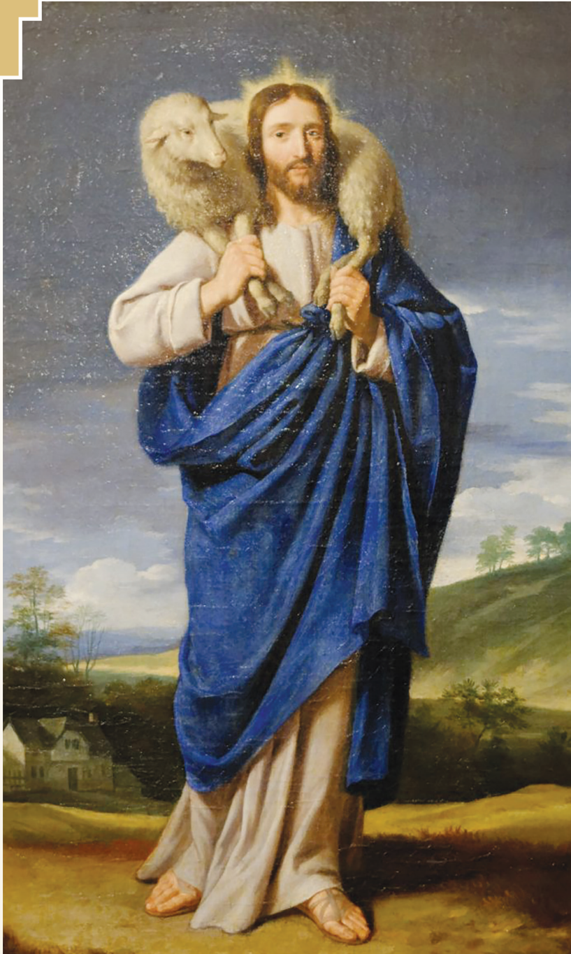
Jezu Krishti, Bari i Mirë