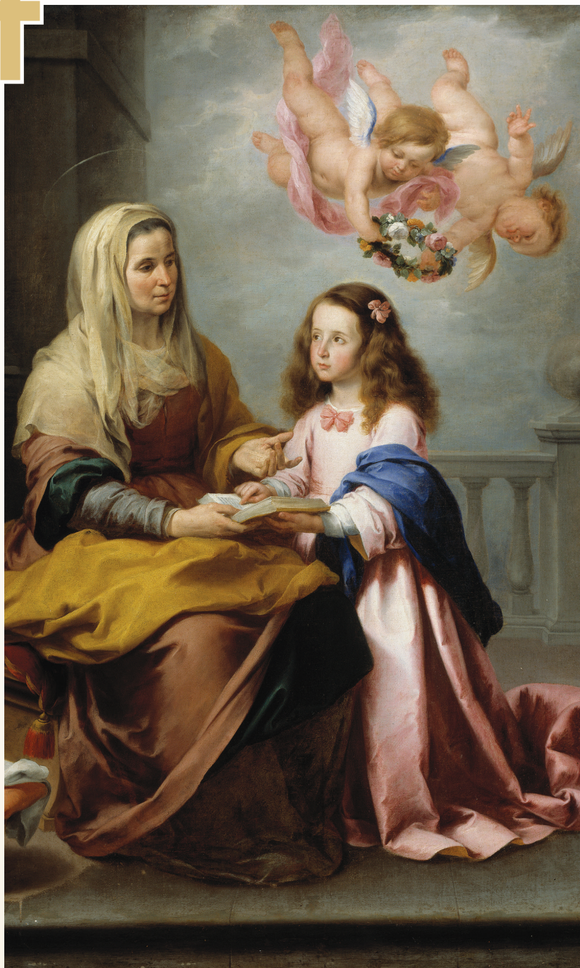
Shën Ana dhe Virgjëra Mari