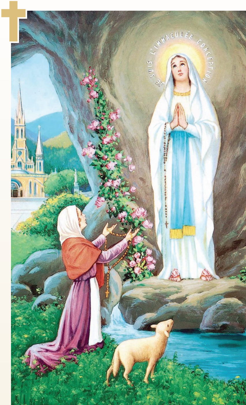
Zoja e Lurdit