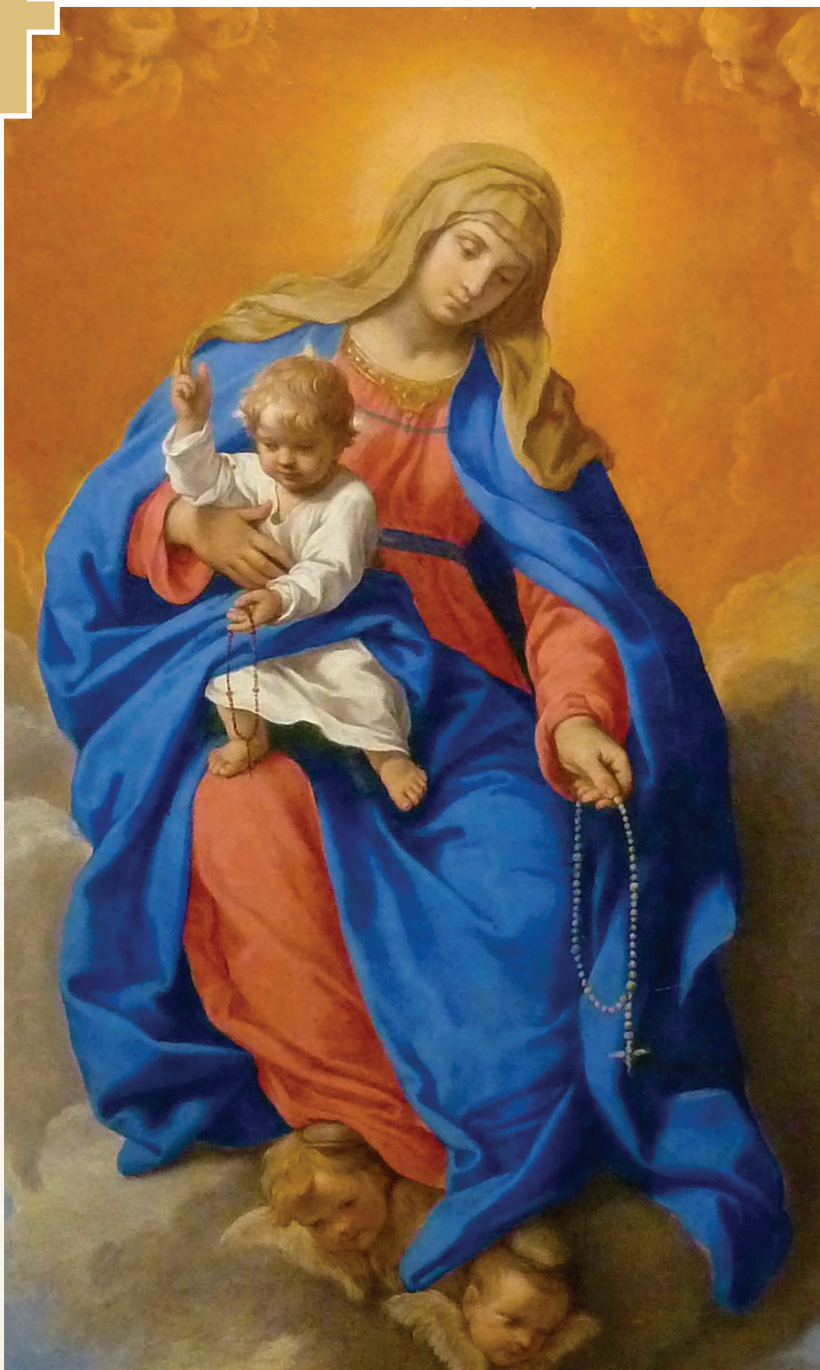
Virgjëra Mari e Ruzares