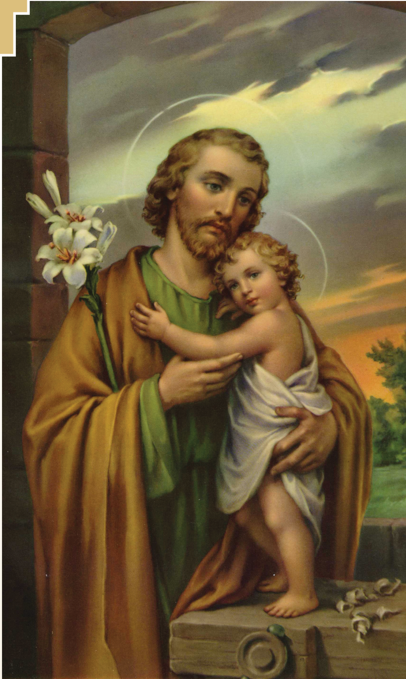
Shën Jozefi, fati i Marisë Virgjër